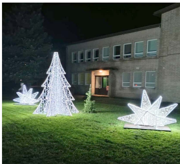
Lõpe klubi esist ilmestavad Adam Lightsi valgusinstallatsioonid.