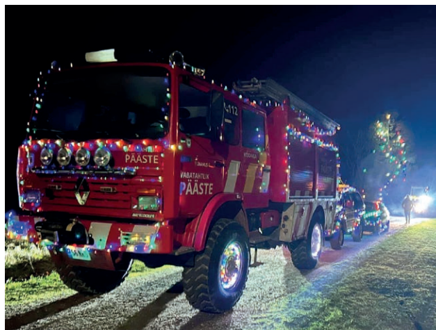
Jõulutuledes autorong koosnes 31 sõidukist.

Aitäh Koonga Vabatahtlike Päästeseltsi meeskonnale! Täname väga jõulurongis osalenuid ning soovime kõigile maagilist jõulukuud! Palju valgust kodudesse kõige pimendamal ajal. Olge kõik hoitud!