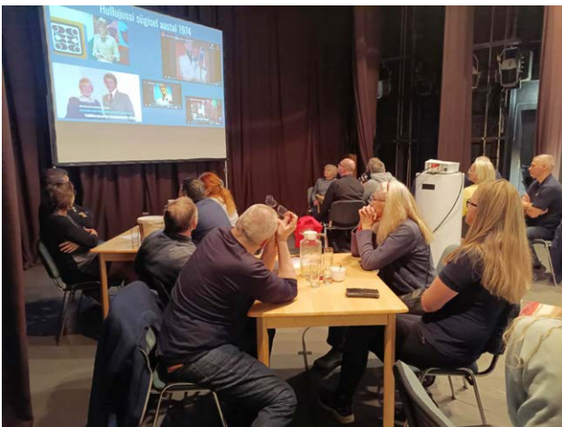
Mälumängus osales kuus võistkonda.

N ovembri viimasel nädalavahetusel toimus Lihula Kultuurimajas Lääneranna ettevõtete esimene meelelahutuslik mälumäng MÕMM.