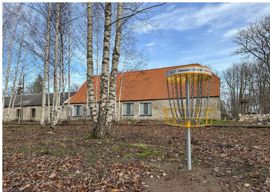
Virtsu discgolf'iväljaku rajamisega alustati kolm aastat tagasi.