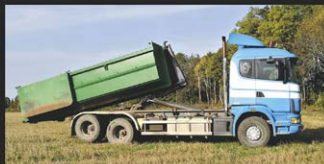
MULTILIFTI TEENUS, KANDEVÕIME 12 TONNI