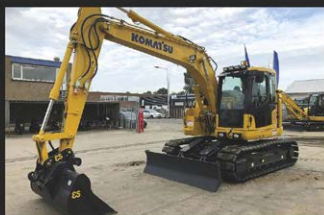
KOMATSU PC 138 US-8, 15 T