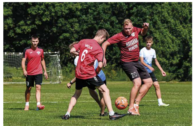
Jalgpallis võidutses Tuudi.