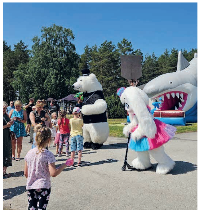
Perepäeva üllatuskülalisteks olid maskotid.

Kõmsi Külaseltsi neljas perepäev oli täis rõõmu, naeru ja põnevaid tegevusi. See oli päev, mis tõi kokku kogukonna liikmed ja pakkus meeldejäävaid hetki kõigile osalejatele. Ootame juba järgmise aasta perepäeva suure huviga!