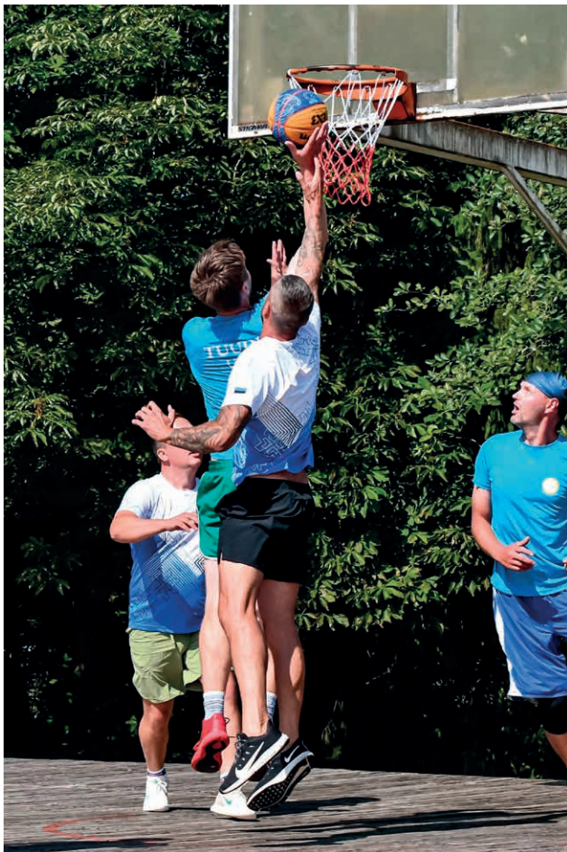
Tänavakorvpallis saavutas esikoha Vatla meeskond.

PDF-formaadis võistluste protokollid leiab Läaneranna Spordihooone veebilehelt.