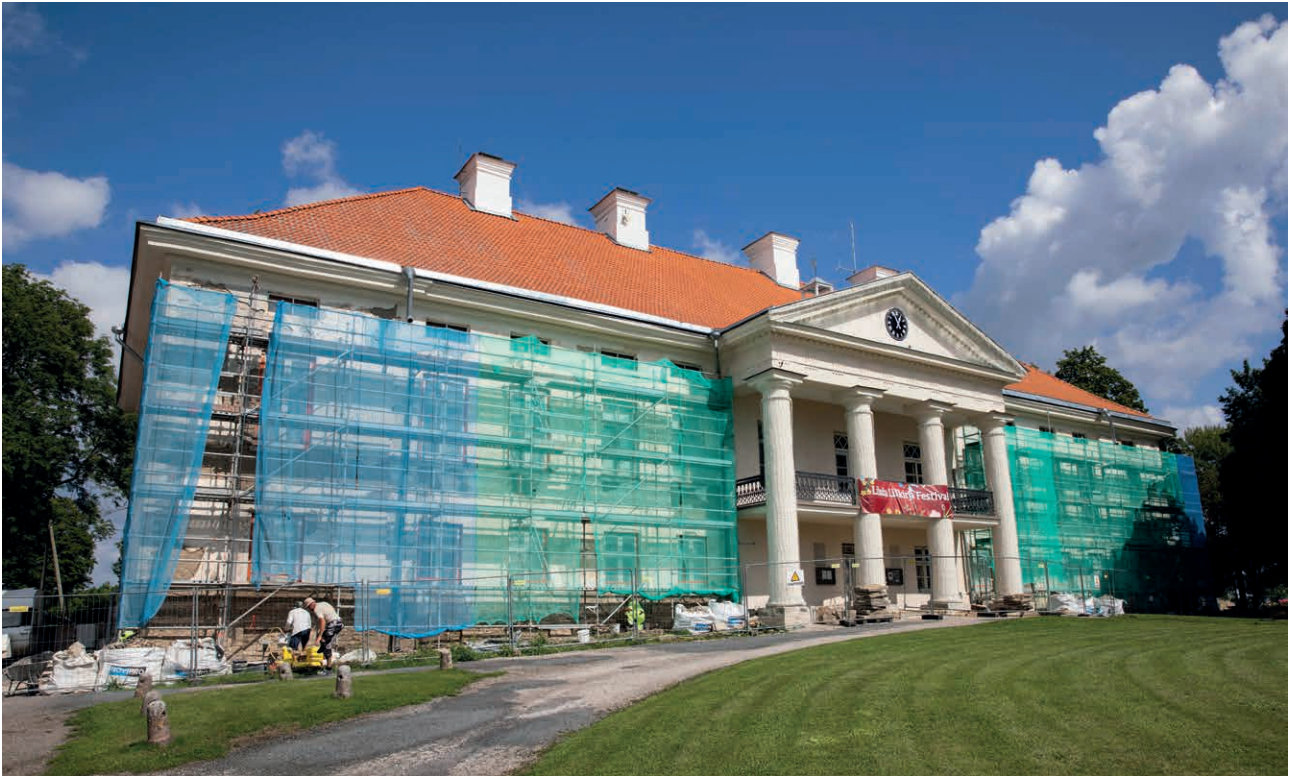
Lihula mõisa esifassaadi renoveerimisega tehti algust juulis.

Lilli Lumera avalike suhete spetsialist ja Lääneranna Teataja toimetaja