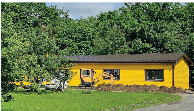
Kõmsi Külaseltsi hoone soojustustööd.

K õmsi Külaseltsi kogukonnakeskus astus hiljuti hoone energiatõhususe parandamisel olulise sammu, kui hoone vundament sai soojustuse ja kaetud ilusa sokliplaadiga.