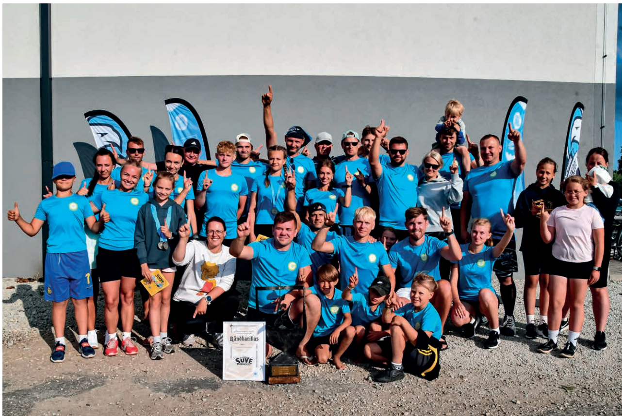
Võidukas Tuudi meeskond.