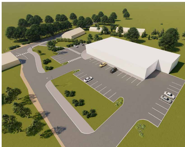
Tallinna mnt 65 detailplaneeringu illustreeriv kavand.

Planeeringu elluviimisega ei kaasne eeldatavalt olulisi keskkonnamõjusid, võimalikud on tavapärased ehitustegevusega kaasnevad ajutised riskid ja negatiivsed mõjud.