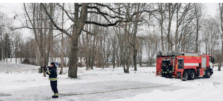
Virtsu Muuseumi parkimisplatsile rajati uisuväljak.