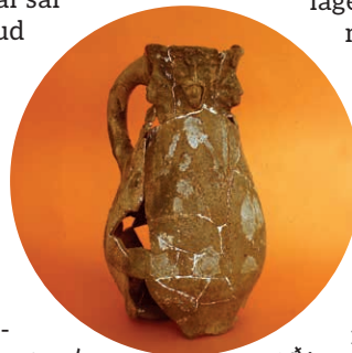
Veinikann 13. sajandist.

Varasematest siin toimunud uurimistöödest on aga põhjalikult kirjutatud raamatus „Läänemaa muinasajast Lihula keskaega“, mis võiks kindlasti leiduda iga omal ajal Lihula kaevamistel osalenud nooruki raamaturiivis. 28. septembril mõisas toimuval konverentsil on see raamat ehk ka Lihulas saadaval.