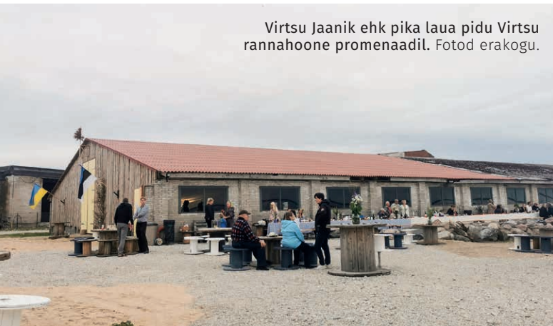
Virtsu Jaanik ehk pika laua pidu Virtsu rannahoone promenaadil.

Virtsu Rannahoone MTÜ on teist aastat järjest korraldanud kodanikele koolitusi. 2023. aastal võõrustati Pärnumaa Arenduskeskuse koolitajaid KOP toetuste ja ettevõtluse arendamise koolituse tegemist. 2024. aastal korraldati koostöös Päästeameti, PPA ja mereohutusega tegeleva Lääne-Eesti Vabatahtliku Reservpäästerühmaga kodanikekoolitusi kriisi, küberturvalisuse ja kelmuste ning mereohutuse teemadel. 2025. aasta kodanike koolituste teemad selguvad 2025. aasta jaanuariks.