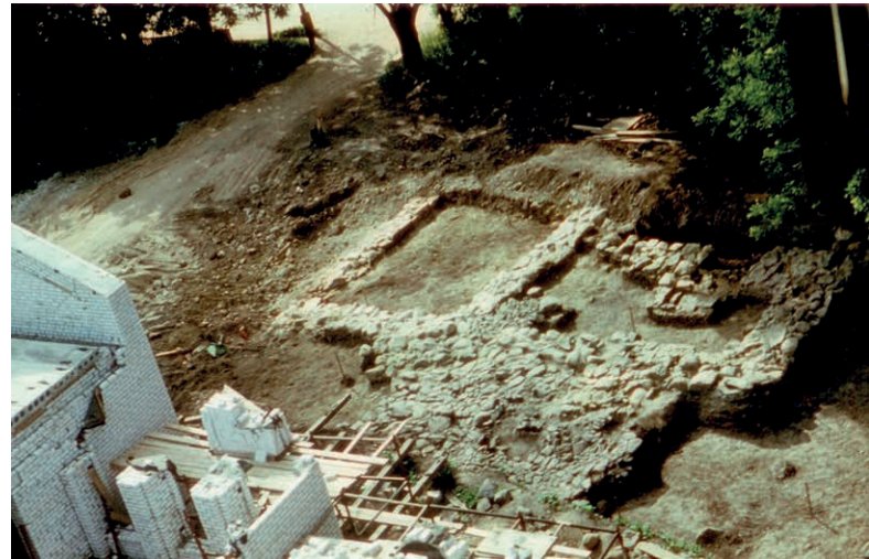
Kultuurimaja ehitamisel avastatud 13. sajandist pärineva maja vundamendid.

Tallinna maanteest loodesse plaanitud kraavi osal saime siiski veel uurimistöid teha. Nüüd oli aga selgunud fakt, millest seni puudus igasugune teave – vanim Lihula oli asunud just siin, mõisa peahoone ja uue kultuurimaja vahelisel alal kahel pool maanteed. Nüüd olime teada saanud ka seda, et selle vanima Lihula