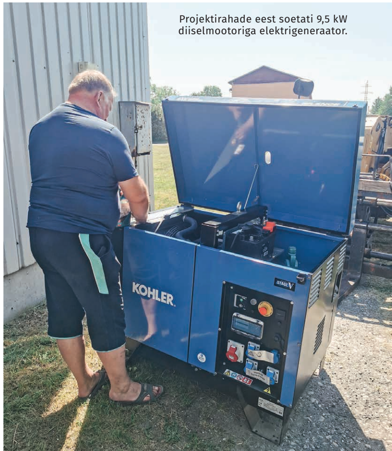
Projektirahade eest soetati 9,5 kW diiselmootoriga elektrigeneraator.