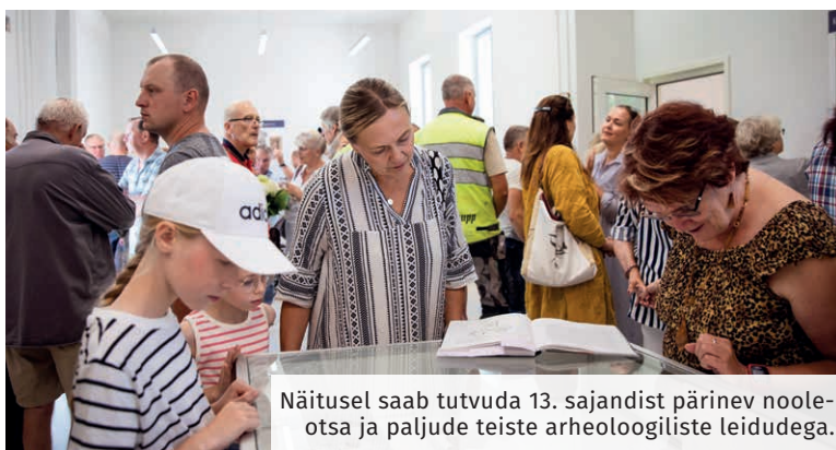
Näitusel saab tutvuda 13. sajandist pärinev nooleotsa ja paljude teiste arheoloogiliste leidudega.