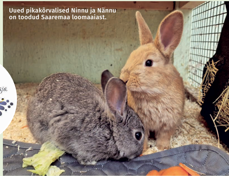
Uued pikakõrvalised Ninnu ja Nännu on toodud Saaremaa loomaaiaist.