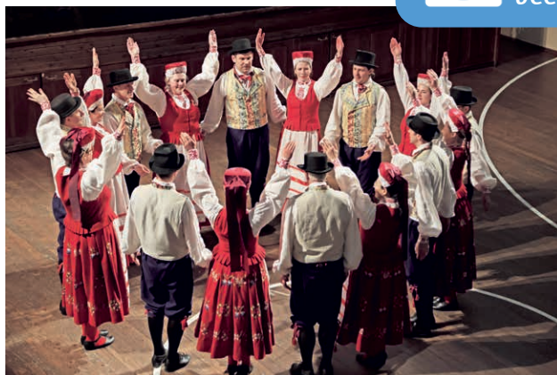
Esinesid tantsurühmad kogu Pärnumaalt.