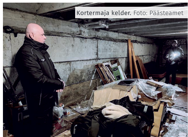
Kortermaja kelder.

Kortermaja varjumiskindluse tõstmise ja toimepidevuse aitab tagada vaid läbimõeldud ja eelarvestatud varjumisplaani! Vaata lisaks olevalmis.ee leheküljelt siseruumidesse varjumise juhiseid.