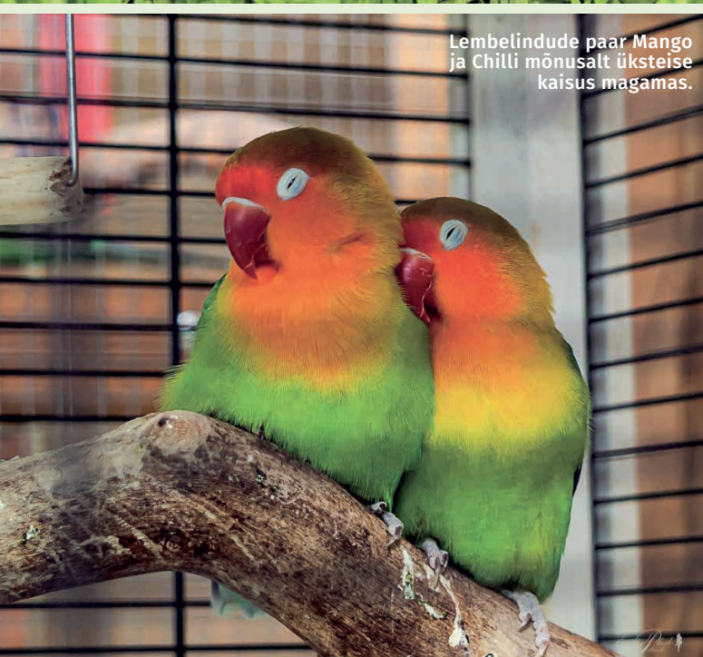
Lembelindude paar Mango ja Chilli mõnusalt üksteise kaisus magamas.