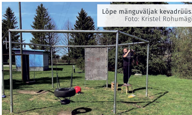
Lõpe mänguväljak kevadrüüs.

„Mänguväljaku peamiseks kasutajateks on noortekeskuse noored ja Lõpe lasteaia lapsed. Kuid pole sugugi haruldane, et sinna tullakse ka naaberküladest ja välisriikidest. Mänguväljaku kõrval asuv parkla ja grillimis-koht meelitavad ligi haagissuvilatega reisivaid turiste, kes vahepeatust vajavad,“ täiendas Rohumägi.