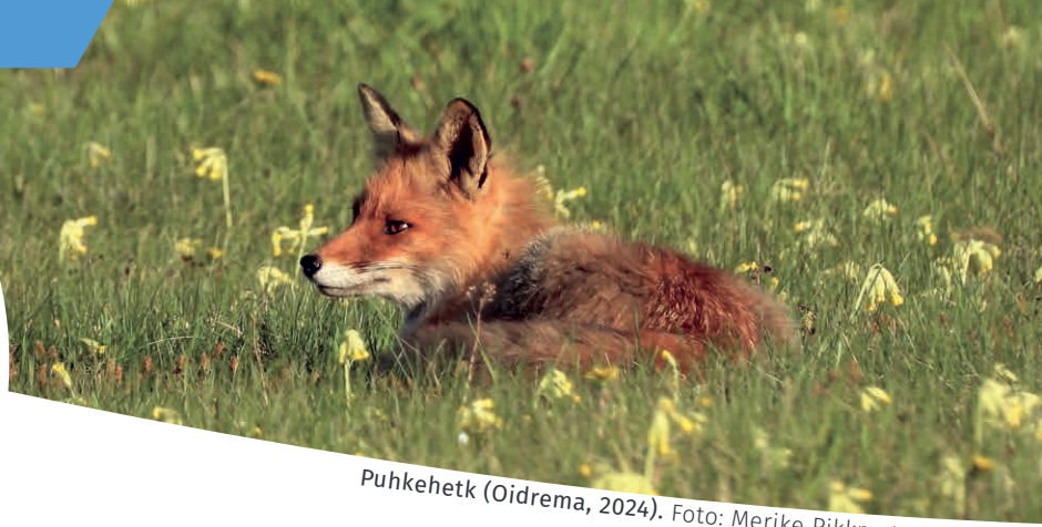
Puhkehetk (Oidrema, 2024). Foto: Merike Pikk mets